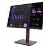
Monitor Lenovo ThinkVision T24i-30 63CFMATXEU