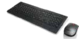
Combo Lenovo Teclado y Ratón Inalámbrico 4X30H56823