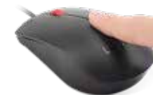
Ratón Lenovo con lector de huella biométrica 4Y51M03357