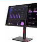
Monitor Lenovo ThinkVision T24i-30 63CFMATXEU