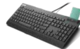
Teclado Lenovo USB Smartcard 4Y41B69380